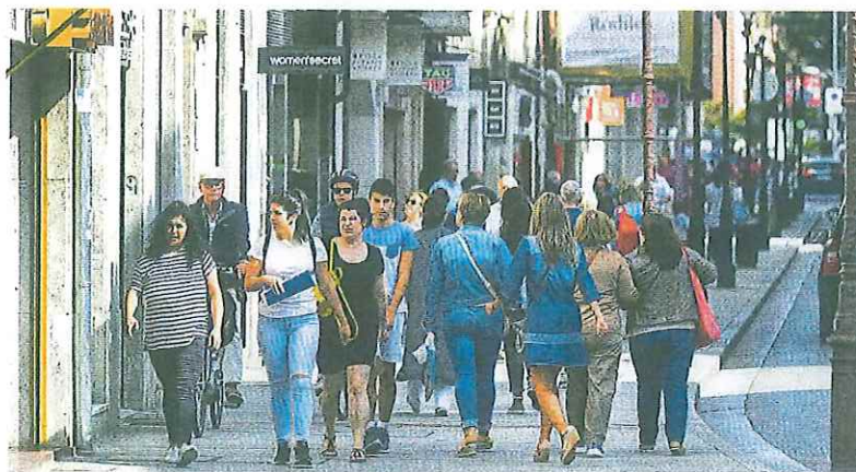
Las mujeres han elevado su porcentaje de creación de empresas hasta el 60%.

que llevamos de 2019 ha crecido la proporción de mujeres emprendedoras. Si tradicionalmente el porcentaje en función del sexo rondaba el 50%, en los datos proporcionados por la Cámara se observa que estas alcanzan el 60%.